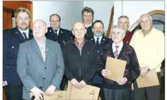
Fördernde und passive Mitglieder der FFW wurden ausgezeichnet

AMMERNDORF - Bei der Jahreshauptversammlung der Freiwilligen Feuerwehr Ammerndorf gab es zahlreiche Ehrungen für fördernde und passive Mitglieder.